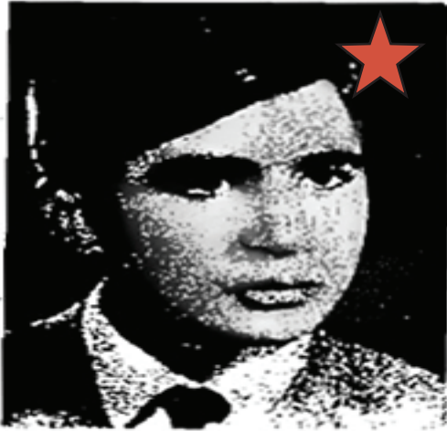
رفیق شهید فرخ سپهری

چریک فدائی خلق رفیق فرخ سپهری در خانواده‌ای زحمتکش در شهر بابل مازندران چشم به جهان گشود. از آنجا که وضع مالی خانواده خوب نبود او از نوجوانی برای تأمین مخارج تحصیل همراه با برادران دیگرش به کار می‌پرداخت. او که از کودکی در خانواده با افکار سیاسی آشنا شده بود کار کردن در محیط‌های کارگری به وی امکان داد با دشمنان مردم از نزدیک آشنا شده و در عمل منشاء فقر و ستم و تحقیر توده‌ها را به عینه ببیند. این تجربه از همان نوجوانی کینه‌زده سرمایه‌داران را در قلبش بارور ساخت. رفیق فرخ با همین کار کردن‌ها توانست مخارج تحصیل خود را تهیه و پس از پایان تحصیلاتش در دبیرستان، وارد دانشگاه تهران در دانشکده فنی شود او در دانشگاه با شرکت عملی در مبارزات صنفی، آگاهی سیاسی خود را با کسب تجربیات عملی غنی‌تر می‌ساخت، به گونه‌ای که فعالیت‌های صنفی دانشجویی او خیلی زود به فعالیت‌های سیاسی بدل شد. در بستر فعالیت‌های سیاسی، رفیق فرخ توانست روابط هر چه بیشتری با فعالین سیاسی ایجاد نماید که این امر امکان دسترسی وی به کتابهای مارکسیستی و عمیق‌تر کردن مطالعات پیشین‌اش را برای وی فراهم نمود. با رستخیز سیاه‌کل و گسترش مبارزه مسلحانه در شهرهای ایران، او همراه با رفیق شاهرخ هدایتی و برادر مبارزش رفیق سیروس سپهری یک هسته مارکسیستی شکل دادند و در اولین گام، خود را برای تحقق این رهنمود رفیق مسعود احمدزاده که «وظیفه هر گروه انقلابی، آغاز مبارزه مسلحانه، چه