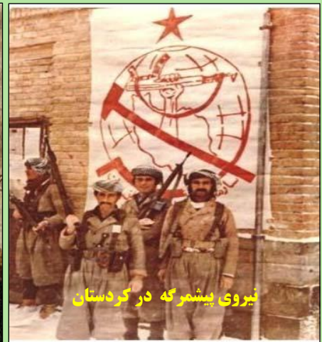
نیروی پیشمرگه در کردستان

برای نمونه برخی از رفقا معتقد بودند حتی اگر لازم باشد باید شاخه کردستان را برای ایجاد حرکت در شمال "تعطیل" کرد. برخی دیگر با تأکید بر ضرورت حضور چریکهای فدایی خلق در جنبش خلق کرد شدیداً با چنین پیشنهادی مخالف بودند. این نظرات می بایست در نشست مطرح شده و مورد بحث قرار می گرفتند. همچنین لازم بود در نشست، اساسنامه موقت سازمان مورد بررسی قرار گرفته و به تصویب جمع می رسید. مطابق این اساسنامه، می بایست شورای عالی سازمان انتخاب شود و باز هم مطابق همین اساسنامه این شورا می بایست مرکزیت جدید سازمان را تعیین نماید.