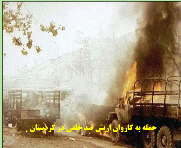
حمله به کاروان ارتش ضد خلقی در کردستان