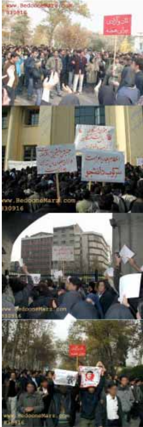
صحنه هایی از تجمع اعتراضی دانشجویان در دانشگاه تهران

پروژه اصلاحات- که البته بهتر است او را یکی از سازماندهندگان و مغزهای وزارت اطلاعات رژیم نامید- هر روز با نوشته جات خود، دانشجویان را از