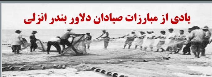
یادی از مبارزات صیادان دلاور بندر انزلی

مهر ماه مصادف با ۳۴مین سالگرد قتل عام وحشیانه صیادان زحمتکش و مبارز بندر انزلی به دست رژیم ضد خلقی جمهوری اسلامی ست. در تاریخ ۲۴ مهر سال ۱۳۵۸، یعنی کمتر از ۸ ماه پس از روی کار آمدن جمهوری اسلامی، حرکت اعتراضی و به حق صیادان که برای احقاق حقوق خود و اجحافات شرکت شبلات به پا خاسته بودند، توسط پاسداران سرمایه و امپریالیسم به خون نشست و بار دیگر به همگان نشان داد که این رژیم مدعی دفاع از "مستضعفان" هر جا که منافع نظام سرمایه داری وابسته و سرمایه داران زالو صفت را در خطر ببیند، از ارتکاب به هیچ جنایتی در حق توده های تحت ستم خودداری نمی ورزد. مبارزات صیادان در سال ۵۸ گرچه با گلوله پاسداران جمهوری اسلامی به خون نشست اما نقش مهمی در افشای چهره جنایتکار و وابسته به امپریالیسم رژیم جمهوری اسلامی و دار و دسته خمینی در تاریخ مبارزات ضد امپریالیستی و دمکراتیک زحمتکشان ما ایفا کرد. یاد تمامی جانبازان مبارزات صیادان زحمتکش گرامی باد!