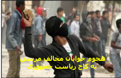
هجوم جوانان مخالف مرسی به کاخ ریاست جمهوری