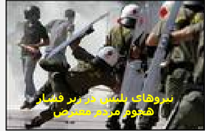
نیروهای پلیس در زیر فشار هجوم مردم معترض

رانده شده اند، تا نظام سرمایه داری حاکم بر مصر را پس از مبارک از گزند مبارزات توده ها مصون نگهدارند. درست به همین دلیل است که این دار و دسته ضد انقلابی فریبکارانه کوشیده اند تا ضمن جا زدن خویش به عنوان نیروی مدافع "انقلاب" و "منتخب" توده ها، به سرعت و با کمک ارتش به ارث رسیده از حکومت مبارک که تا مغز استخوان به امپریالیسم آمریکا وابسته است، دیکتاتوری مورد نیاز نظام سرمایه داری و طبقه استثمارگر حاکم در مصر را بازسازی نموده و به مردم نیز اینگونه القاء کنند که گویا با سقوط حسنی مبارک و روی کار آمدن آنها "انقلاب" مصر به پیروزی رسیده و مردم هم باید به خانه هایشان بازگردند.