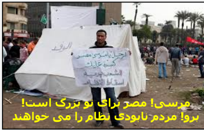
مرسی! مصر برای تو بزرگ است! برو! مردم نابودی نظام را می خواهند