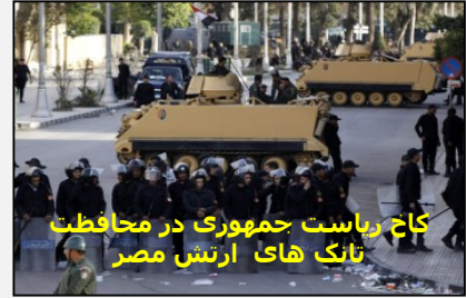
کاخ ریاست جمهوری در محافظت بانک های ارتش مصر